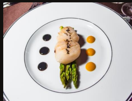
Теплая закуска Гребешки на зеленой спарже