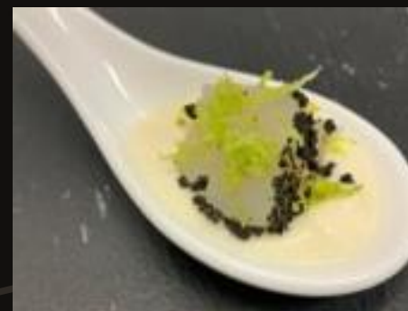
Гребешок с пюре из цветной капусты и белого шоколада