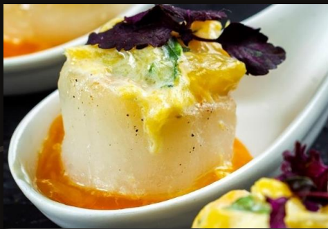
Гребешок салатом из манго и базилика с соусом маракуйя