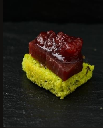
Желе из гребешка с малиной на черном тосте