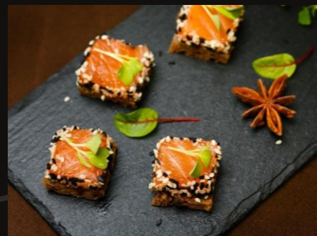
Лосось на клубничном бисквите и парфе из лимонника