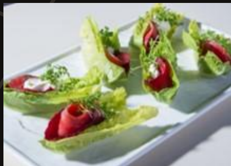
Лосось маринованный с малиновым соусом