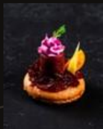
Имбирный тарт с уткой и луковым конфитюром