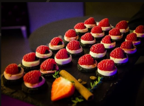
Желе из гребешка с малиной на черном тосте