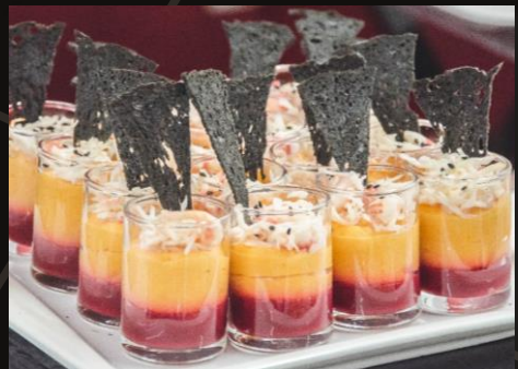
Крабовый риет с тыквенным муссом и вареньем из брусники