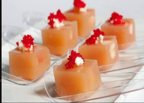
Креветка в желе из грейпфрута