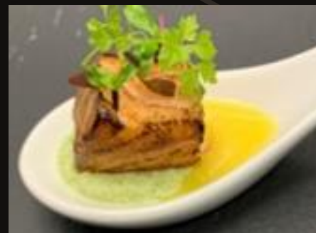
Лосось опаленный с пюре из брокколи и манговым соусом