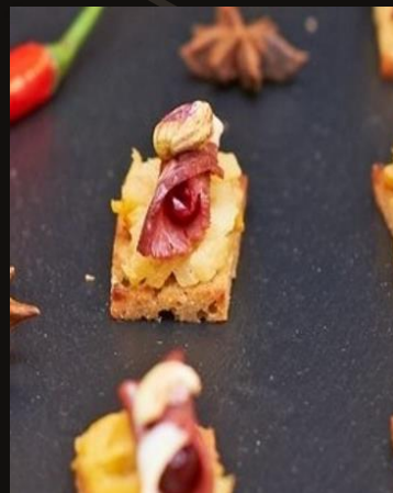
Яблочное шотне со слайсом копченой утки и свежей брусникой на имбирном тосте