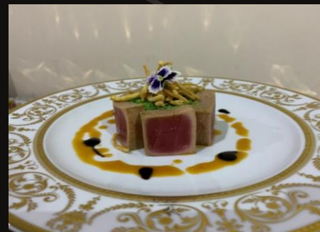
Холодная закуска Татаки из тунца с салатом «Чука»