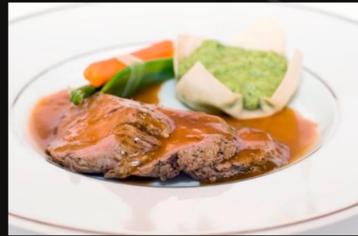
Медальоны из телятины с пюре из брокколи