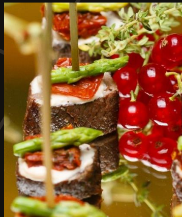
Ягненок с вялым томатом и спаржей