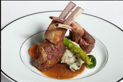
Каре баранины с картофельно- трюфельным пюре