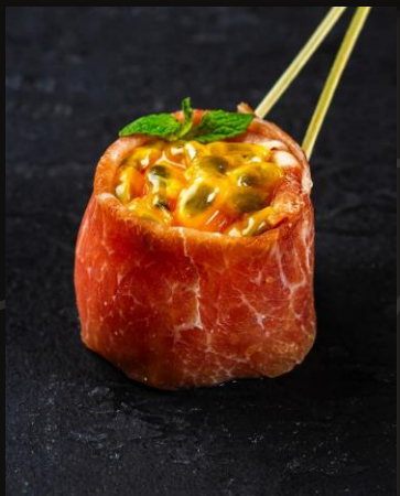
Парма с дыней канталупа и маракуйей