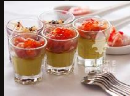
Тар-тар из тунца с гуакомоле и красной икрой