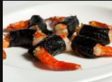
Креветка васаби в нори