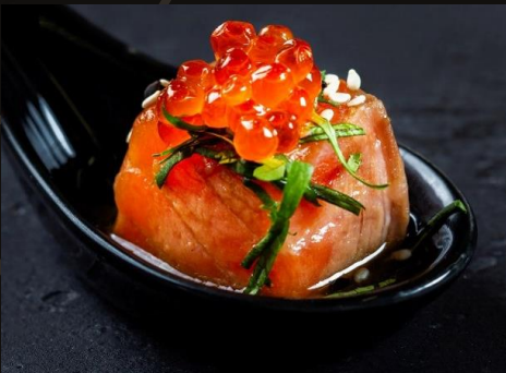
Сашими из лосося в имбирном маринаде