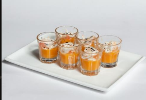
Крабовый риет на пюре из тыквы