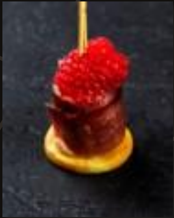
Подкопченная утиная грудка с клюквенным конфитюром и малиной