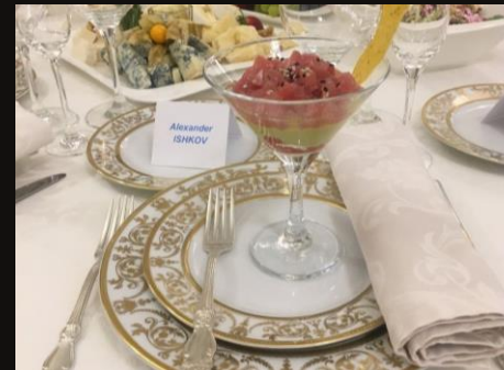
Тар-тар из тунца с гуакомоле