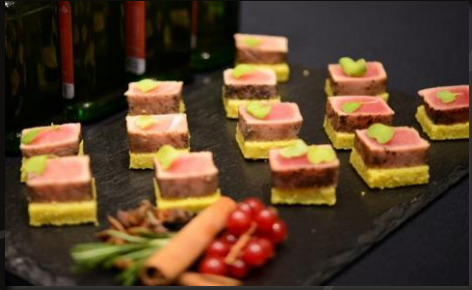
Тунец татаки на пряной паленте