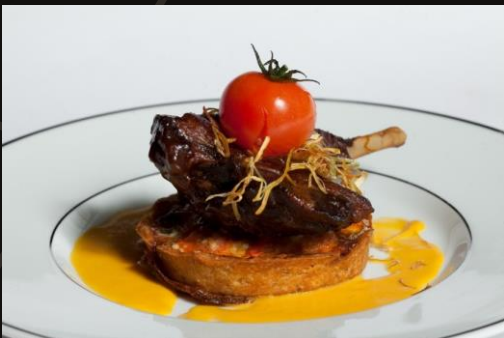
Утиная ножка «Конфи» на овощном рататуте с тыквенным соусом