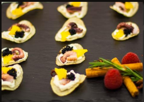
Осьминог с сливочным кремом и апельсином на Картофельной чипсе