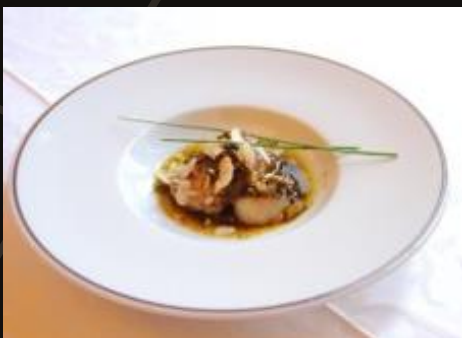
Горячая закуска Гребешки с Фуа-Гра и ореховым соусом