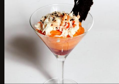
Крабовый риег с муссом из тыквы и брусничным соусом