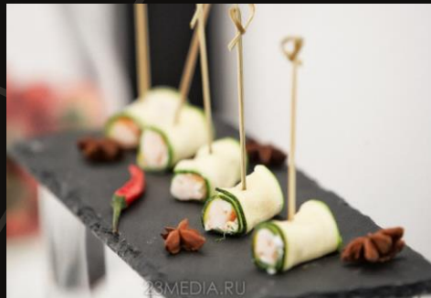
Креветка в цукини и сливочном сыре