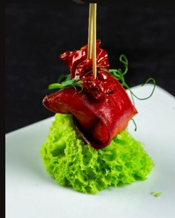
Бреазола с муссом из рикотты и вялеными томатами