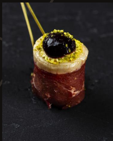
Утка Магре с фисташками и ягодным соусом