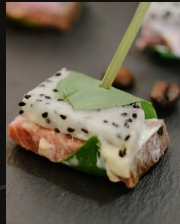
Канapé из телятины с петахайо