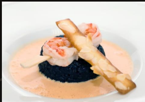
Горячая закуска Гречетто с брошеттой из креветок с соусом «Биск»