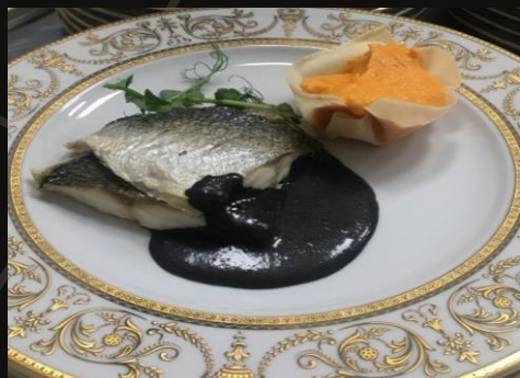
Филе Дорадо с соусом из черной фасоли с пюре из моркови