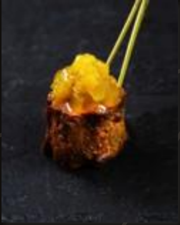
Томленый в мёде ягненок с чатни из груши