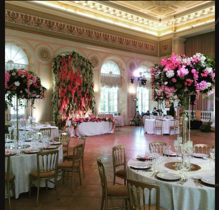
Зал на Острове