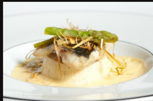
Филе сибаса на зефире из спаржи