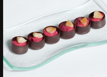
Гребешок на свекольном муссе в шоколадной чашечке