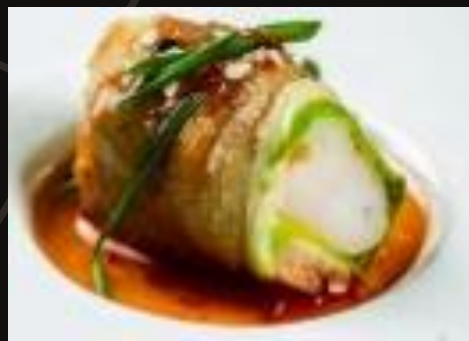
Креветка в цукини и беконе