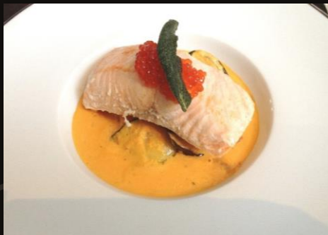
Филе лосося на овощном рататуте