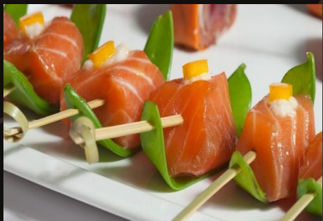
Лосось маринованный в стручковом горохе