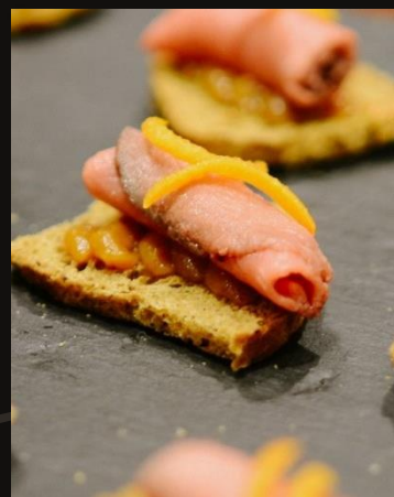
Телятина на зерновом крустате с абрикосовым конфи