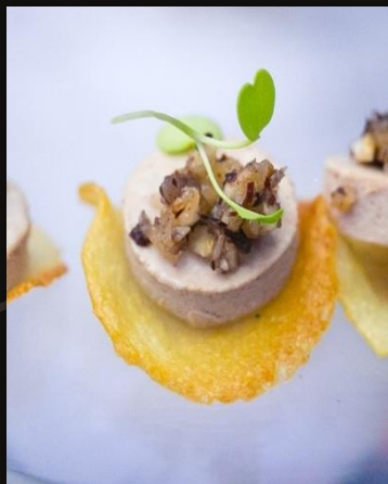
Яблочная крустата с панакотой из утки